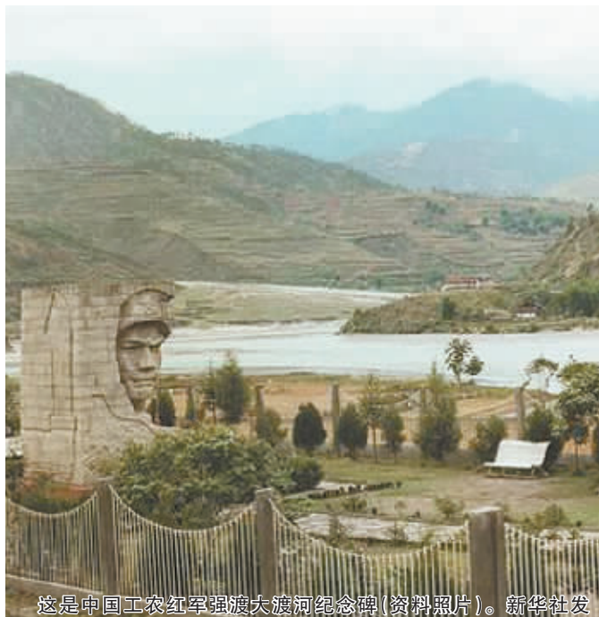
这是中国工农红军强渡大渡河纪念碑(资料照片)。新华社发