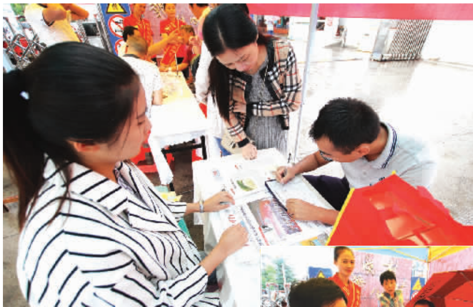
▲市民现场订阅2017年《信阳晚报》 ▲景福堂国药馆医师为市民义诊

信阳消息(首席记者 周涛)“订晚报,送礼品,还能免费检查身体,这样的活动亲民!点赞!”8月26日上午,浉河区湖东办事处报晓新村社区门口分外热闹,本报“进社区送健康 扫码订报有礼”活动在这里如约开启。尽管秋雨淅沥,凉意阵阵,但听说晚报进社区,众多老读者、新朋友纷纷汇集,热情参与。