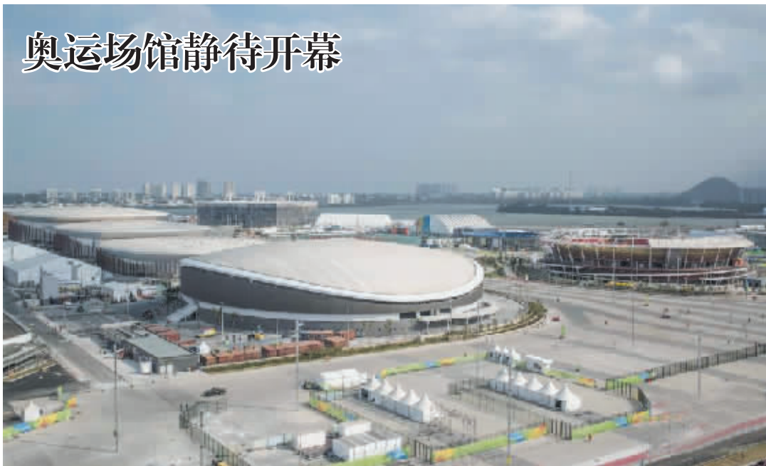
里约奥运会开幕临近,目前各场馆已准备就绪。图为巴哈赛区的体育馆。