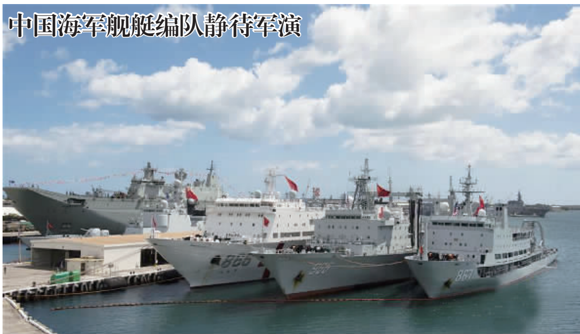
中国海军舰艇编队静待军演

参加“环太平洋-2016”演习的中国海军舰艇编队近日陆续完成多项港岸训练计划,扎实做好演习各项准备,舰队将于当地时间7月12日上午和其他参演国海军一道出海,在预定海域进行海上实施阶段的演习项目。