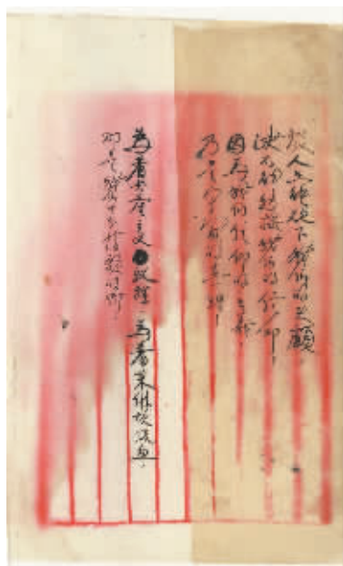
方志敏在狱中的作品之一——《死!——共产主义的殉道者的记述》

中央档案馆内,珍藏着方志敏的《可爱的中国》《清贫》《狱中纪实》等大量的书信、文稿原件,这其中,很多章节已成为家喻户晓的名篇。这些极其珍贵的革命历史档案都是方志敏在昏暗的牢狱中的心血之作,字里行间流露出一位共产主义者对信仰的绝对忠诚和舍身取义的高贵品质。