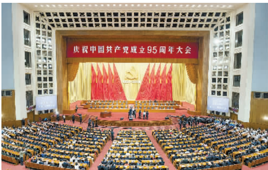
7月1日,庆祝中国共产党成立95周年大会在北京人民大会堂隆重举行。