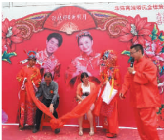
孙权好夫妇中式婚礼现场。

信阳消息(记者 王洋)前几日,一场美国新郎跨马游街迎娶信阳女孩的中式婚礼,在信阳这座小城引起了不小的轰动。而就在昨日,平桥区胡店乡的一对新人也选择用具有中国风韵味的婚礼,来纪念自己婉转悠长的爱情。记者走访我市多家婚庆公司了解到,近年来,我市不少新人厌倦了千篇一律的西服婚纱、玫瑰花车的西式婚礼,带有民族风俗礼仪文化的中式复古婚礼正日益受到他们的青睐。