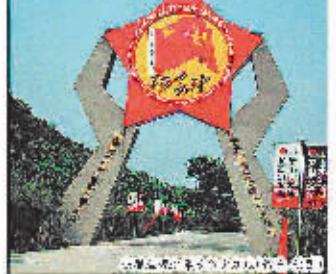
信阳历史文化名城