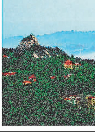
信阳历史文化名城