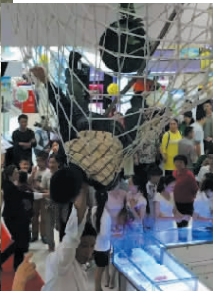
5月7日,在平桥西亚商场,一男孩玩耍时不小心从3楼掉下,在掉到1楼时被护栏网拦住,悬在半空。后经工作人员协助,孩子被成功解救,所幸并无大碍。在此,提醒广大家长带孩子出门时一定要看护好孩子,以防发生意外。