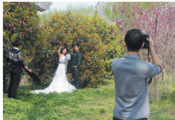
一对新人在户外拍摄婚纱照。

信阳消息 (见习记者 郭晓雨)进入三月,申城到处繁花似锦,很多即将迈入婚姻殿堂的新人们都想趁着大好春光拍一套美美的婚纱照。连日来,记者走访市区多家婚纱摄影公司了解到,今年婚纱照拍摄旺季提前,部分公司的预约已经安排到8月份。业内人士提醒消费者,在底片费用收取、婚纱使用门槛等方面容易存在陷阱。