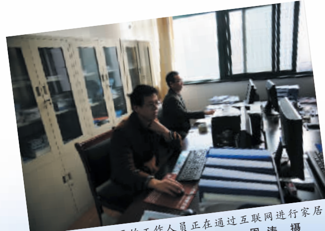
家居小镇园区的工作人员正在通过互联网进行家居产品营销