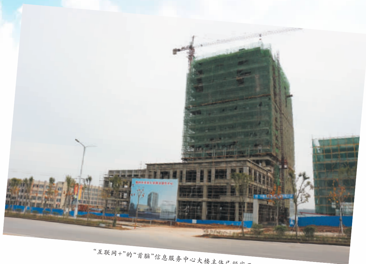
“互联网+”的“首脑”信息服务中心大楼主体已经完工

在“互联网+”的时代，不光是一些家居电商瞄准了商机，同时许多家居生产厂商也非常重视互联网这个平台。信阳市富利源家居有限公司总经理杨景荣告诉记者，现今他们公司的网上销售已经占到年销量 5%~10%的份额，未来几年这个市场份额还将继续扩大。通过互联网平台，不仅增加了销量，而且还实现了品牌营销，很多消费者通过网上平台的展示对公司的品牌与产品进行了解。 “‘双十一’期间，我先后 6 次走进‘鄂豫皖一日达’电商物流园，去观摩网络销售的现况，时刻关注着网络市场的变化。未来家居市场的 O2O 定制家具将更受人们的欢迎，要实现定制家具的销售，就必须依托互联网平台。”信阳德克家具有限公司董事长梁万龙说，“2016 年将是我们