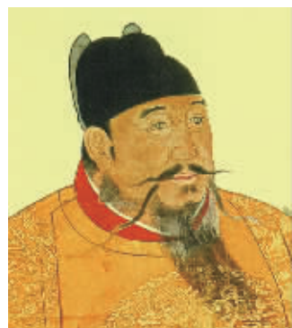
“龙须”飘飘的明成祖朱棣画像。