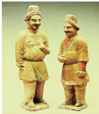
深目、高鼻、多须的西域胡人形象(唐俑)。