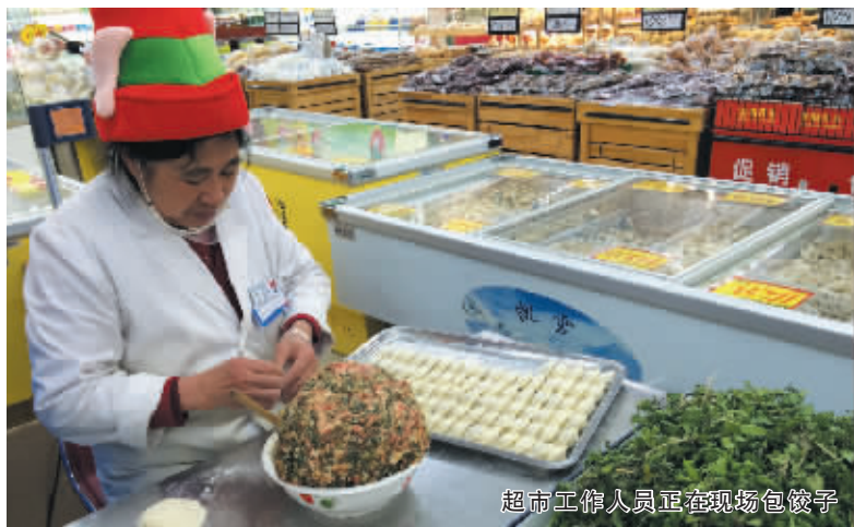
超市工作人员正在现场包饺子