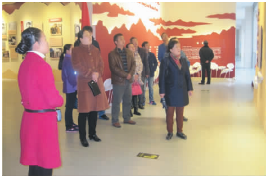
近日,信阳农林学院图书馆全体党员来到“大别山红廉文化苑”,接受反腐倡廉教育。党员们纷纷表示,要以史为镜、以案为鉴,严于律己,始终坚守廉洁自律,筑牢拒腐防变的思想防线;以身作则,严守党的政治纪律、严明党的政治规矩。