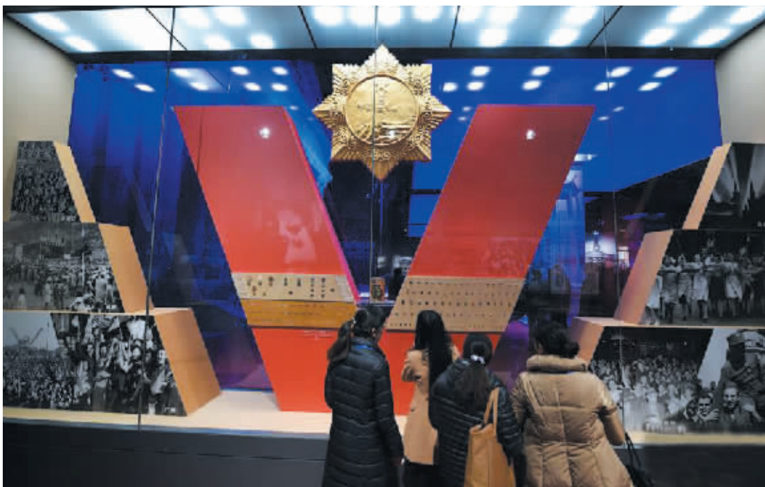
12月7日,参观者在侵华日军南京大屠杀遇难同胞纪念馆新馆参观。当日,历时1年多的侵华日军南京大屠杀遇难同胞纪念馆三期扩容工程竣工开馆,举行“正义必胜、和平必胜、人民必胜”主题展开展仪式。新馆总用地面积为29683.93平方米,其总体定位在原有的“历史”与“和平”两大主题上,增加“胜利”主题,共展出图片1100余幅、文物6000余件(套)。

据华春莹介绍,应李克强邀请,马西莫夫、梅德韦杰夫、萨里耶夫将在出席会议前后对中国进行正式访问。李克强还将与梅德韦杰夫举行中俄总理第二十次定期会晤。(据新华网)