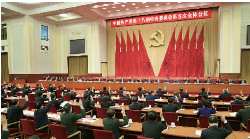
中国共产党第十八届中央委员会第五次全体会议,于2015年10月26日至29日在北京举行。中央委员会总书记习近平作重要讲话。