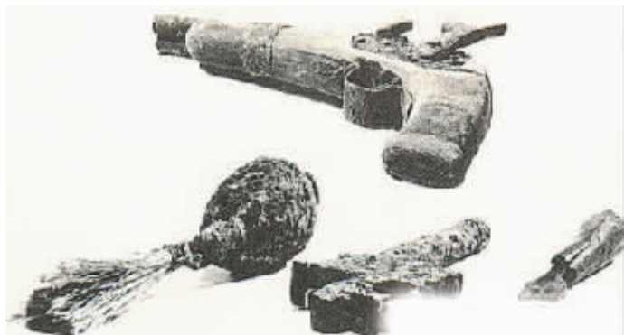
红军兵工厂自制的武器

红军在军事上的重大胜利，为根据地的建设提供了有利的保障。翻身的农民，在苏维埃政府的领导下，以极大的热情投入到根据地的建设之中。