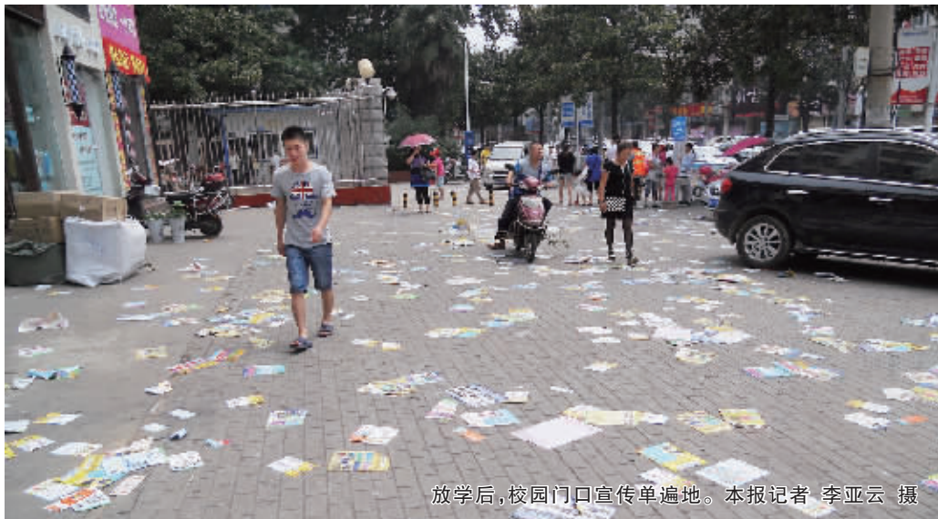
放学后,校园门口宣传单遍地。

信阳消息 (记者 李亚云) 学生开学了,各类培训机构也纷纷前来“报到”。形形色色的宣传单在校门口被散发给家长和学生,学校门前成了各类宣传单的集聚地。人流散去,遍地狼藉,繁重的清扫工作让环卫工人叫苦不迭。