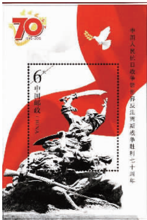
图为“中国人民抗日战争暨世界反法西斯战争胜利 70 周年纪念邮票小型张”图案

为纪念中国人民抗日战争暨世界反法西斯战争胜利 70 周年,中国将发行中国人民抗日战争暨世界反法西斯战争胜利 70 周年纪念币、《中国人民抗日战争暨世界反法西斯战争胜利七十周年》纪念邮票。这是记者 19 日从国新办新闻发布会上获悉的。