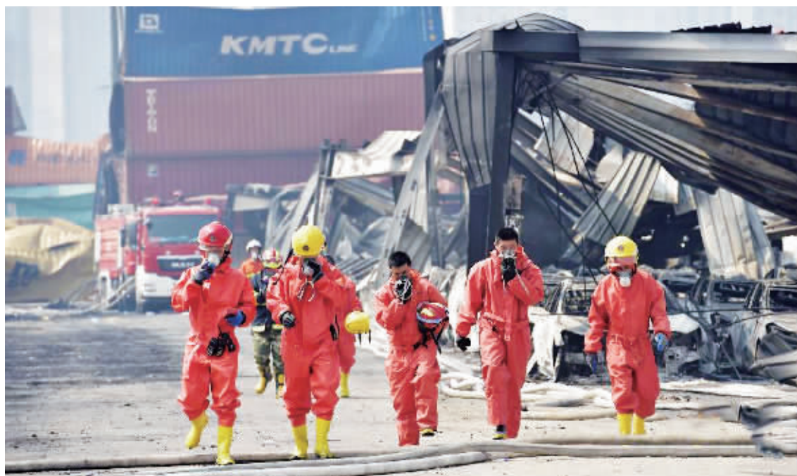
8月16日，救援人员继续深入天津港“8·12”瑞海公司危险品仓库特别重大火灾爆炸事故现场开展救援工作。截至16日9时，事故现场已发现112具遗体，其中确定身份24人，88人身份尚未确定。