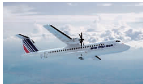
ATR-42型支线飞机(资料图)