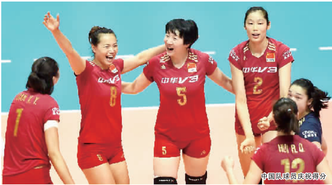
中国队球员庆祝得分

2015年世界女排大奖赛香港站的比赛18日在香港红磡体育馆落幕,中国队在最后一场比赛中,以3:2击败美国队,获得冠军的同时迎来九连胜。