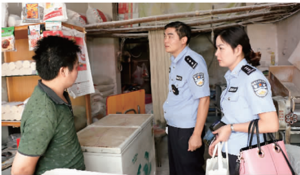
夏季是用电高峰期,为确保人民群众的生命财产安全,近日,浉河区老城办事处联合公安部门在辖区内开展拉网式安全用电隐患排查。通过排查,消除商铺和家庭用电方面存在的安全隐患。

截至目前,浉河区共为津乾机械等14家企业提供担保贷款3580万元。并进一步探索创新融资服务手段,满足企业在借款时限、资金额度上的需求,充分利用风险投资、股权投资、信用保险、金融租赁等金融工具,帮助企业多渠道融资。