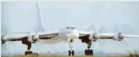
图-95 是前苏联图波列夫飞机设计局为苏联空军研制的远程战略轰炸机。1951 年开始研制,1954 年第一架原型机首次试飞,批生产型于 1956 年开始交付使用。早期型共生产了 300 多架,除用作战略轰炸机之外,还被用来执行电子侦察、照相侦察、海上巡逻反潜和通信中继等任务。80 年代中期,图-95 轰炸机又开始恢复

生产,主要生产可带巡航导弹的图-95MC 轰炸机和由图-95 改型的海上侦察/反潜机图-142M3 型。1992 年停止生产。现在约有 150 架图-95M/K/MC 仍在服役,与 40 架图-160 变后掠翼超音速远程轰炸机和 220 多架图-22M 中远程超音速轰炸机一起,共同组成俄罗斯的战略轰炸机部队。