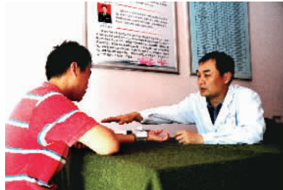
6月6日下午, 谯堂社区军民门诊部专家为居民详细检查诊断。

信阳消息(董宇辰)解放军第154中心医院定期组织专家深入社区居民点, 直接面对面服务基层群众, 受到热烈欢迎。该院今年年初在金牛山办事处谯堂社区成立了第一个“军民共建门诊部”, 由不同专科的专家定期轮流免费坐诊, 为辖区居民提供快速便捷的医疗保健服务。