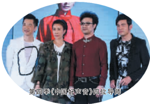
第四季《中国好声音》四位导师

大型音乐励志评论类节目《中国好声音》6月2日在上海举办新闻发布会,宣布第四季正式启动。四大导师周杰伦、那英、汪峰、庾澄庆首次同台登场,不同的音乐态度碰撞出激烈火花。《中国好声音》史上最年轻导师周杰伦一出场便受到热烈欢呼,成为人气最高的导师。值得一提的是,周杰伦新导师上任,不仅遭遇三人联盟“夹击”,还承诺若遭遇昆凌生娃也不会找接班人,会对学员负责到底。