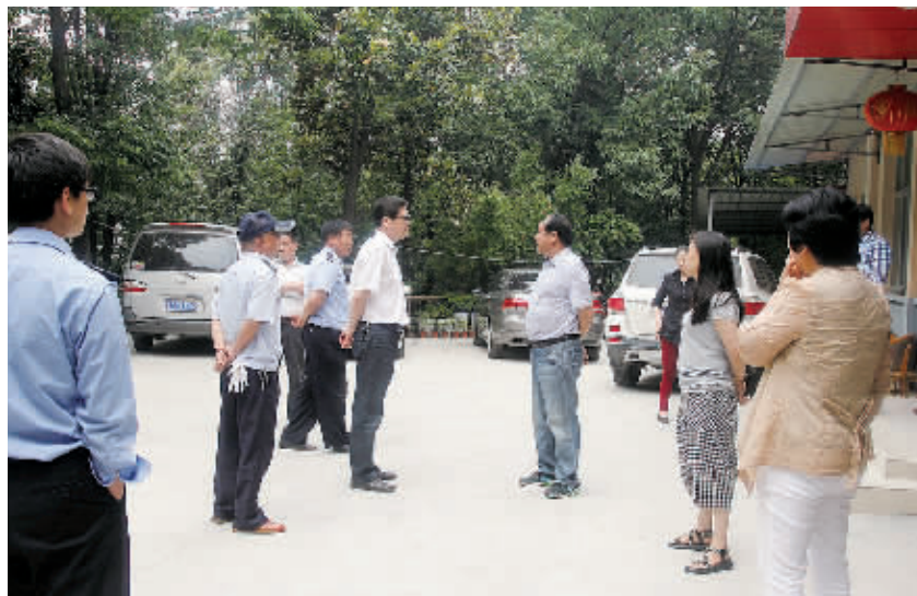
工作小组对饭店经营户进行批评告诫