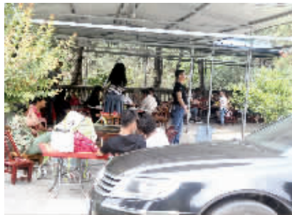
在“大山地锅饭店”吃饭的游客

5月23日上午,由南湾湖风景区管理委员会牵头,市环保局、海事局、食品药品监督管理局、南湾公安分局、南湾工商分局、南湾水库管理局、南湾林场、南湾办事处、贤山办事处、旅游公司等部门成员共同组成的南湾水库饮用水源保护工作领导小组,针对日前市民在网上的爆料“信阳燕尾岛的农家饭庄死灰复燃了,废水直接流到南湾湖里”,在饮用水水源地保护区内“兵分三路”,展开了一次专项整治行动,重点开展水上“禁泳”、打击保护区内经营“地锅饭”以及查扣非法运营船只工作。上午10时,记者来到保护区门口与工作小组会合,随后全程跟随其中一路,了解相关情况。