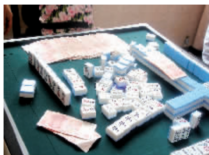
在某地锅饭店内收缴的赌资赌具