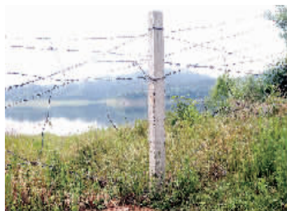
保护区内被破坏的铁丝栅栏