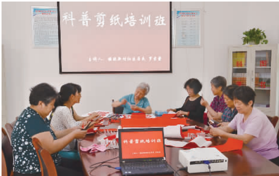
报晓新村社区居民在科普大学里学剪纸