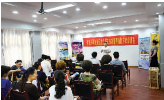
专业人士为鲍氏社区居民讲解旅游知识