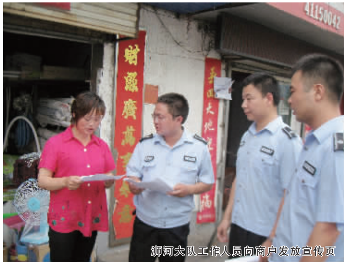
浉河大队工作人员向商户发放宣传页

信阳消息(记者 吴楠)“您好,电动车不允许出店经营,请推回室内!”5月13日下午,在我市中心城区民权路,来自市城市管理综合执法局执法支队浉河大队的工作人员走上街头,规劝民权路商户不要出店经营。在工作人员的劝说下,商户十分配合地将车辆推回商铺中。