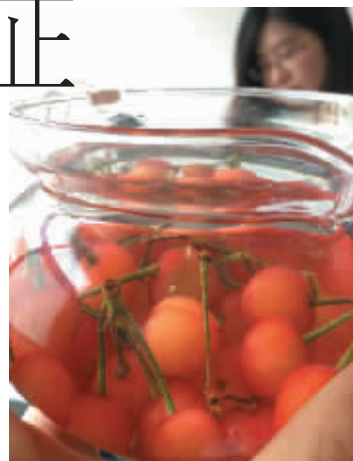
记者亲自实验进行求证

若想不吃到虫子,最好用盐水浸泡一会儿,等各种幼虫都爬出果子,就基本脱去动物蛋白了。