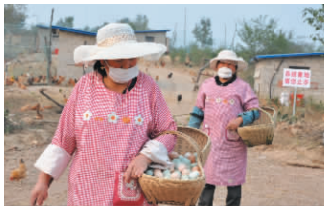
工人从养殖场捡蛋归来

市区专卖店地址:沿河大道浉河壹号35号门店 电话:0376-6767893 阳春农家乐订餐电话:18236277098