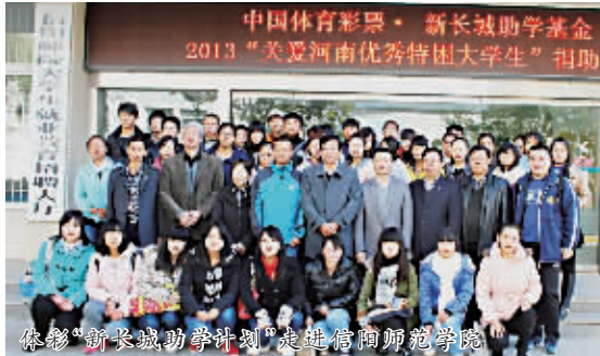
体彩“新长城助学计划”走进信阳师范学院

精彩提示 体彩大乐透3.6亿元超级大派送将于5月初开启，连续6周每期三派送6000万，由当期头奖中奖注数均分，当期派不完则继续滚存，派奖力度史无前例，当期加奖金额历史最高！敬请期待！