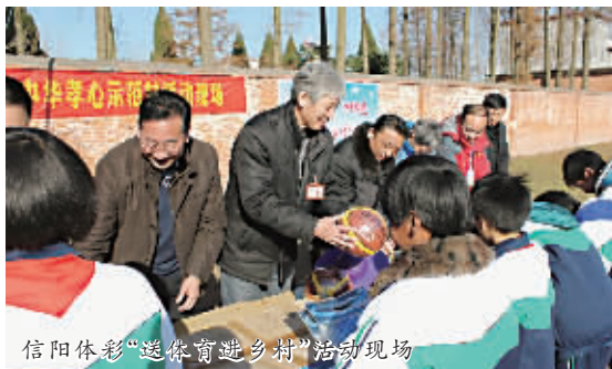
信阳体彩“送体育进乡村”活动现场