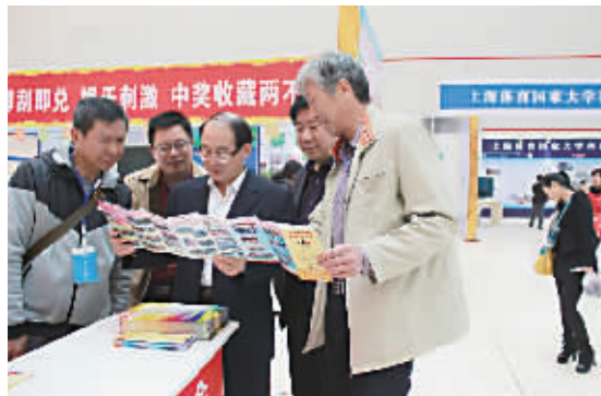
市体育局领导关心体彩事业发展