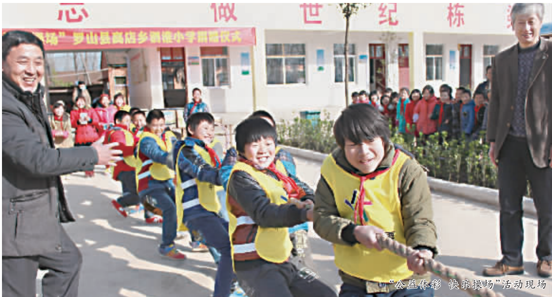
“公益体彩 快乐操场”活动现场