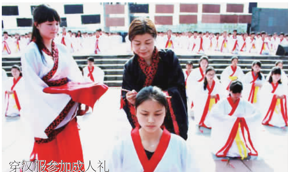
穿汉服参加成人礼

农历三月初三,是中国古老的传统节日——上巳节,又称为“女儿节”。4月21日,湖南省洪江市举办“三月三”女儿节活动,千名14周岁至24周岁的年轻女子,身穿传统服装,队列整齐,依照古时习俗庄严宣誓,体验成人大典。(据中新网)