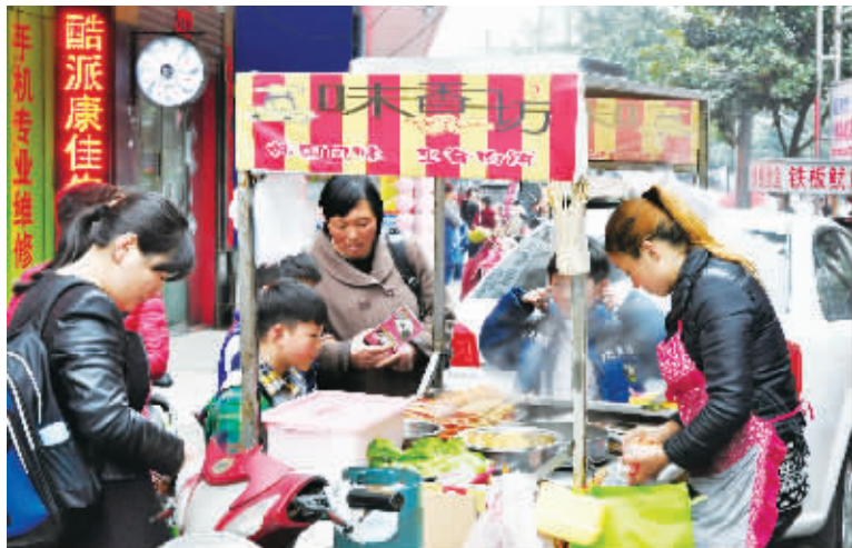
小摊被放学后的学生围住

信阳消息(记者 韩蕾)“不能买路边摊的东西,咱回家,奶奶给你包包子吃!”下午5时,小学生陆陆续续放学了,不过原本应该回家的四年级学生月月,却被校门的小吃吸引住,迟迟挪不动脚步,来接她放学的姥姥百般劝说无效后,只得给她买了块发糕。