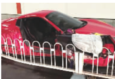
法拉利右车门掉落