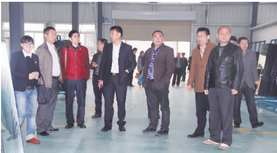
4月6日,由信阳市家具协会牵头组织的东莞市信阳商会企业家一行11人到信阳国际家居产业小镇考察。企业家们表示,他们对家乡的投资环境、投资前景十分看好,对信阳家居产业的发展充满了信心。图为企业家一行在天一美家公司1号车间参观。

现在市场上家装的新古典主义风格就是后现代主义风格的分支。在古典形式的背后,新古典主义建筑表现出开放性和现代精神,并为“古典如何步入现代”开创了一条重要的道路。