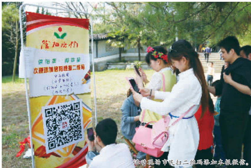
活动现场市民扫二维码添加本报微信。

信阳消息 (记者 韩蕾)“我是晚报的老读者了,每天看看《信阳晚报》,对我和我的家人来说已经成了习惯,现在添加了微信公众号,我只要打开手机