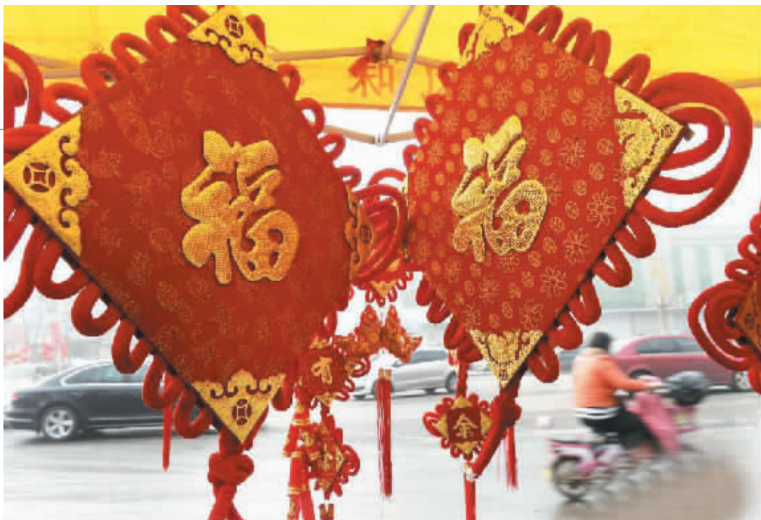
张灯结彩迎佳节 新春佳节临近,我国各地城乡张灯结彩,喜气洋洋。