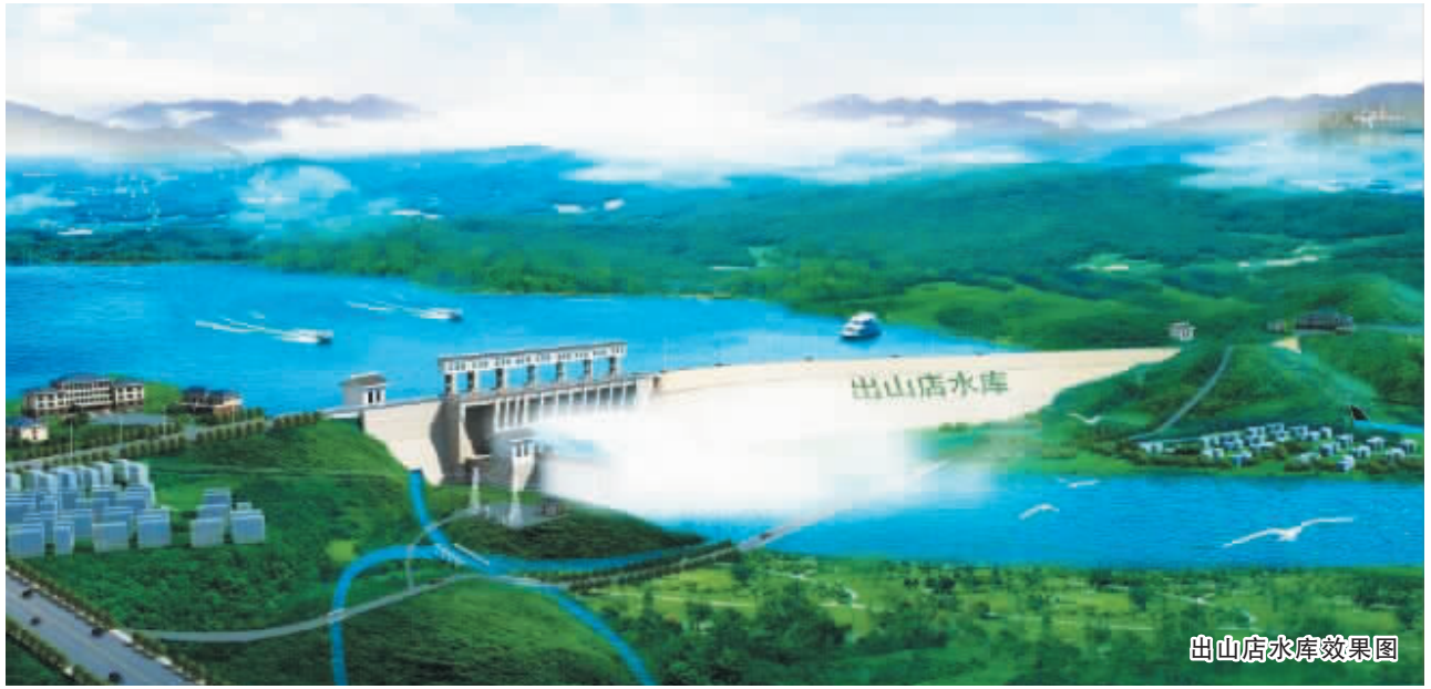
出山店水库效果图

(信阳)国际茶业博览会,来自海内外的200余家茶商、茶企、茶组织近1000位客商和代表共襄盛会。期间还分别举行了2014中国(信阳)国际茶业博览会、中国茶叶流通协会茶叶深加工与茶食品专业委员会一届二次会议暨中国茶叶深加工领域食品安全与经济运行专题研讨会、中国国际茶商大会、信阳国际茶城茶相关产品展示交易会等相关茶事活动。