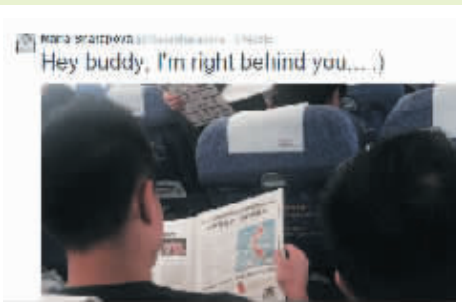
莎娃微博:“嘿伙计,我就在你后面呢……”