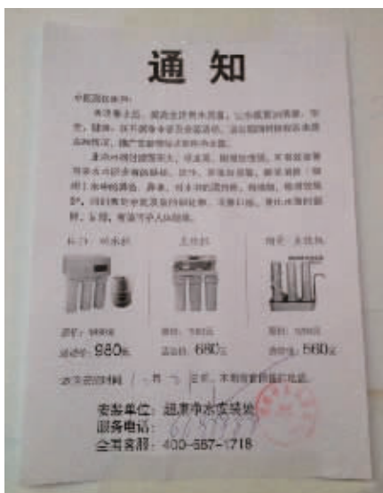
张贴在小区楼道里的“净水通知”

员辱骂、甚至诅咒不购买者,属于强行推销,市民在遇到此类情况或认为自己被强迫购买商品时,可拨打12315进行投诉,如果情节严重,可拨打110报警电话。”