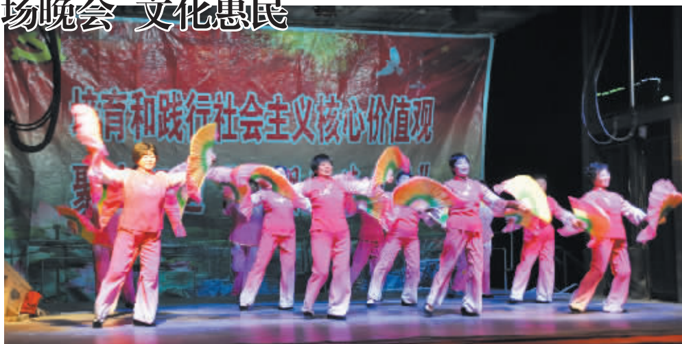
12月1日夜晚,息县淮楼广场灯火辉煌,人潮涌动,由该县县委宣传部主办,以培育和践行社会主义核心价值观,聚力打造“文明道德息县”为主题的广场文艺晚会在这里举行。晚会融大型歌舞、豫剧清唱、男女声独唱、息县大鼓、快板书等表演于一体,节目《圣贤教育开新花》《千部吃亏歌》《道德模范张学兰》等采用传统与现代艺术相结合的方式,创新了表演形式,赢得了群众的好评。

1996年,儿子突患癫痫;2007年,母亲患食管癌;2014年,父亲患脑动脉瘤——