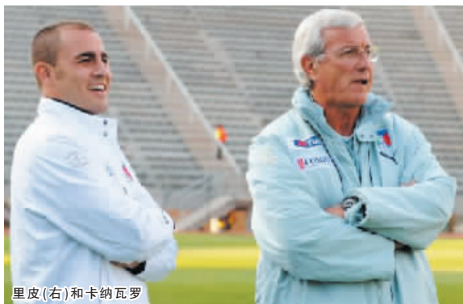
里皮(右)和卡纳瓦罗