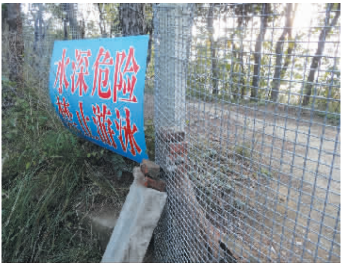
图为市民为翻铁丝网进湖游泳临时搭建的水泥墩。

信阳消息(记者张勇见习记者陈奕兆)南湾湖是信阳市民的“大水缸”,为保护饮用水源,禁泳、取缔地锅饭、安装防护网,我市各部门通力合作,作出了不懈努力,然而,铁丝网却经常被人剪破。22日,记者就在燕尾岛大铁门前看见,新安装的加粗的铁丝网又被剪个大窟窿。