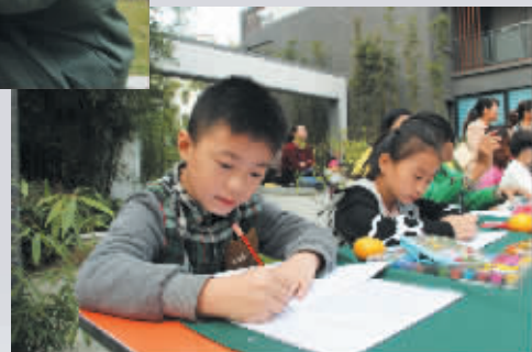
全神贯注的“小画家”