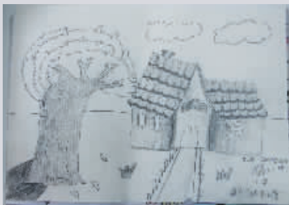
金奖作品——《林中小屋》 罗山第一实验小学 五(四)班 周昱坤