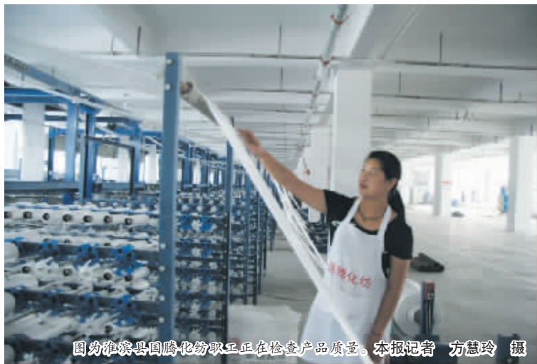
图为淮滨县国腾化纤职工正在检查产品质量。