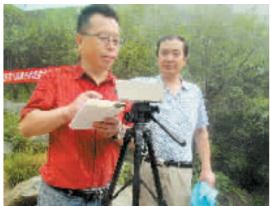
图为专家在记录测定的负氧离子含量数值。

负氧离子浓度瞬间最大值高达每立方厘米 47.8 万个,是我国空气负氧离子保健浓度评价标准最高等级的 228 倍,是世界卫生组织规定的“空气清新”标准的 478 倍