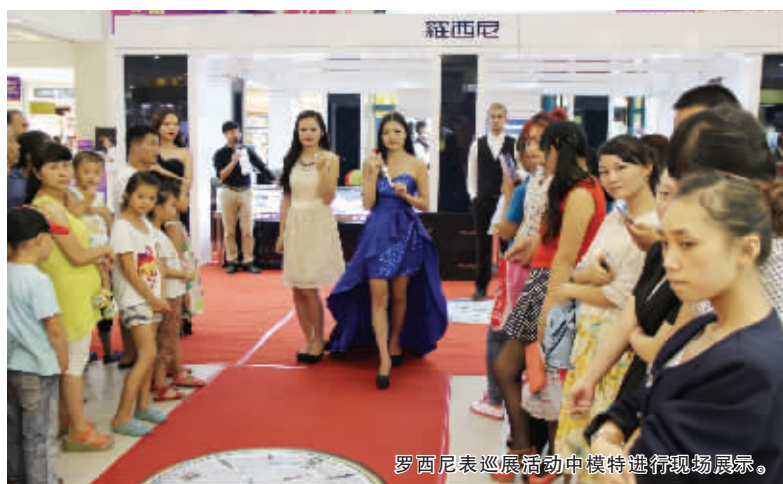
罗西尼表巡展活动中模特进行现场展示。