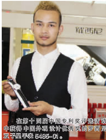
在第十四届中国专利奖评选活动中获得中国外观设计优秀奖的罗西尼双子星手表5435-01。

由河南金爵实业有限公司和大商集团信阳新玛特共同举办的新玛特第二届钟表文化节自8月8日开始以来,受到了我市广大市民的普遍好评,活动准备充分、优惠力度大、促销形式多样等都是此次钟表文化节的亮点。在此次钟表文化节开展得如火如荼之际,国际知名品牌罗西尼表举办了巡展活动,旨在进一步推广罗西尼2014年推出的公务系列产品,活动为期8天。记者了解到获悉,此次钟表文化节恰逢罗西尼30周年庆,活动期间,罗西尼正价款全场7.5折销售,特供表款折扣低至3折。罗西尼系香港上市公司中国海淀集团旗下知名企业,为中国表业唯一“亚洲品牌500强”,品牌价值、市场销量和市场综合占有率均位列中国表业之首,是国内手表行业的最受欢迎的名牌产品。罗西尼坚持自主品牌,自主设计,成立至今,已开发上市了1000余款手表,并成功完成光电能电表、多功能运动表、陀飞轮表、高度防水手表等一系列国际先进水平的创新成果,产品受到了消费者的广泛赞誉。