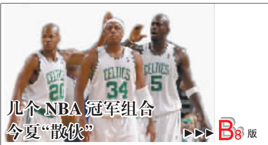
几个NBA冠军组合今夏“散伙”