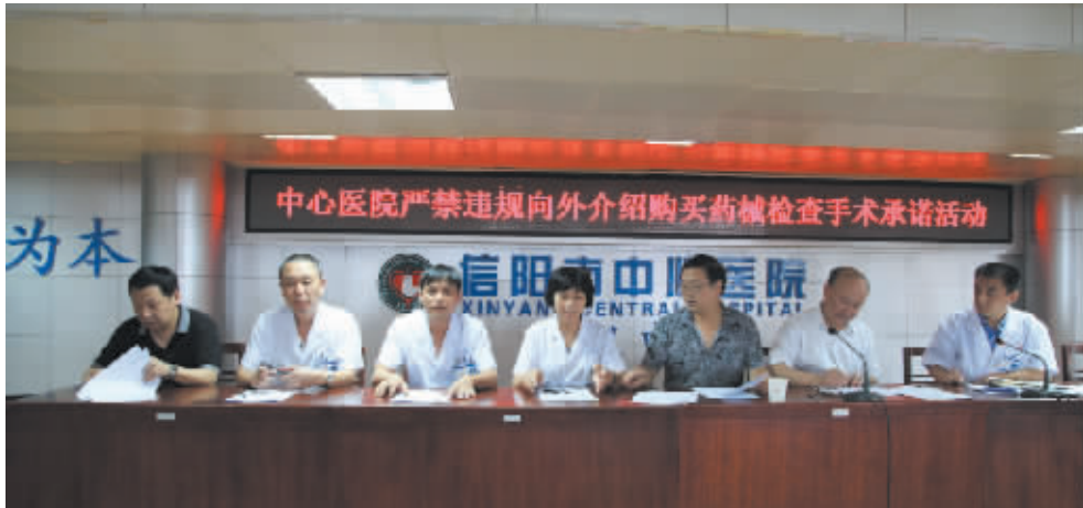
为大力加强医德医风建设,构建和谐的医患关系,7月31日下午,市中心医院召开全院中层以上领导干部和中级专业技术职称以上人员大会,在全院开展干部职工违规经商和收受红包回扣提成及向院外介绍购买药械检查手术问题专项治理活动。图为部分大科主任代表在现场签订《廉洁行医承诺书》《拒绝医药回扣承诺书》和《拒绝过度用药、过度治疗、过度检查诚信承诺书》。

此次大比武活动为期两天,有16支参赛代表队48人参赛,队员来自信阳市八县两区各医疗机构的医师、临床药师及护士。通过本次大比武活动,提高了药师们对于处方点评工作的重视程度和实战技能,进一步强化了处方质量和药物临床应用管理,规范了医师处方行为,推动了药师严格执行处方审核、发药、核对与用药交代等的相关规定并加强了医院间的互动交流与学习。