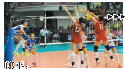
郎平:中国女排很年轻 有进步空间