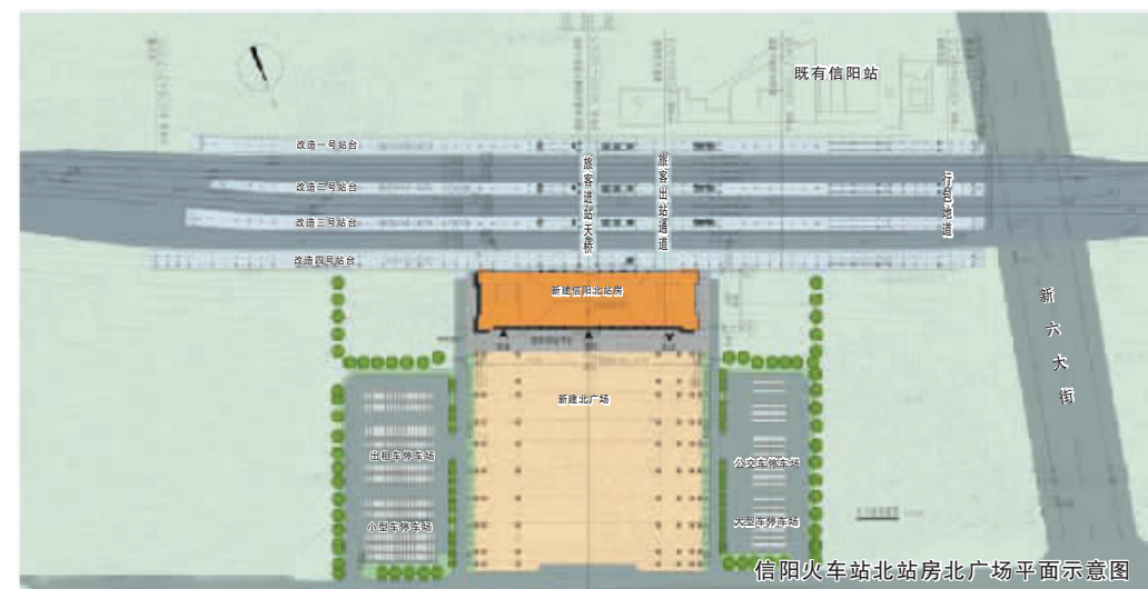
信阳火车站北站房北广场平面示意图