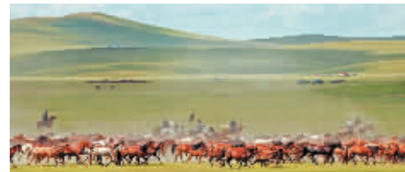
令人心旷神怡的呼伦贝尔大草原