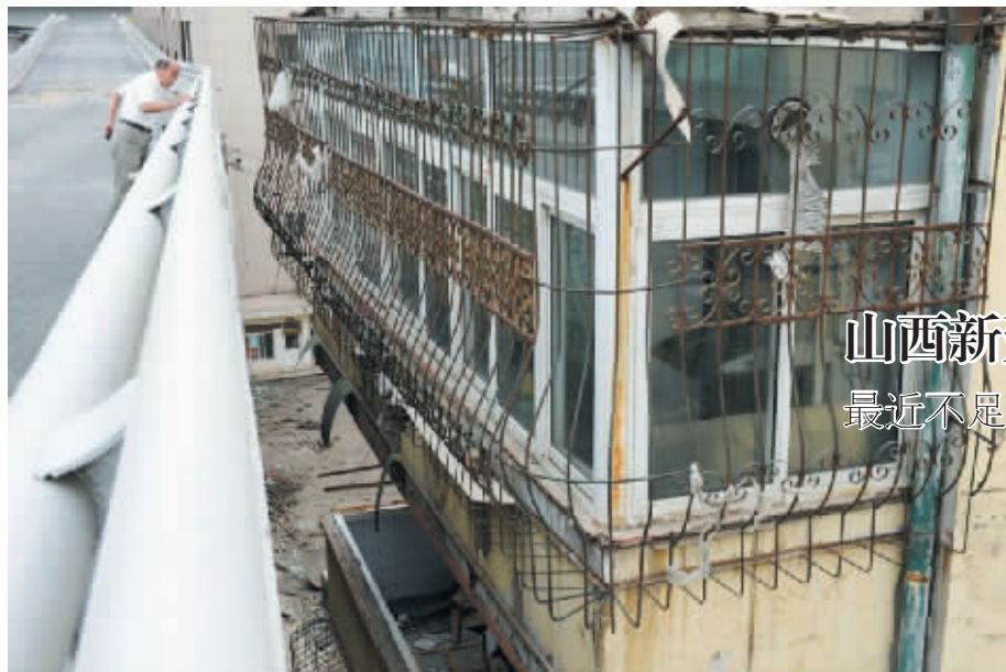
山西新建高架桥紧贴居民楼 最近不足半米

此外,招标投标监管方式也将改革。住房城乡建设部要求试行非国有资金投资项目建设单位自主决定是否进行招标发包,是否进入有形市场开展工程交易活动。(据人民网)